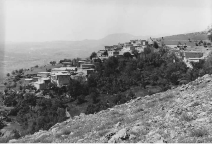
Ocak Köyü'nün gurbete göç etmeden önceki görünümü