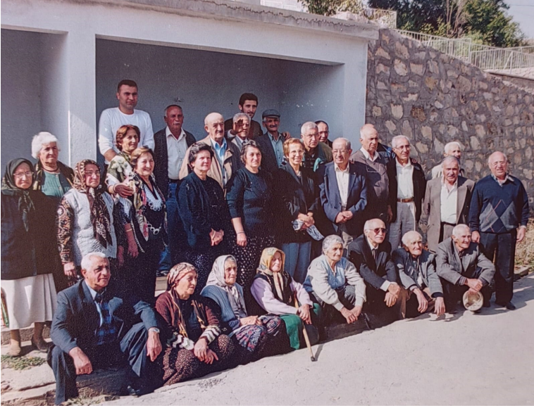
Geçmiş Zaman olur ki: Ocaklıların Köyde Bayram Günü Hatırası.