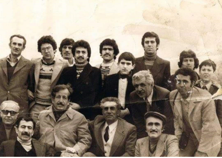
Geçmiş Zaman Olur ki, Ocaklıların İstanbul Hatırası