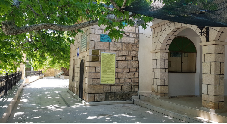
Son Onarımı Ocaklı Hayıresever Rahmetli Ali Rıza Şimşek tarafından yaptırılan Hidir Abdal Sultan Türbesi