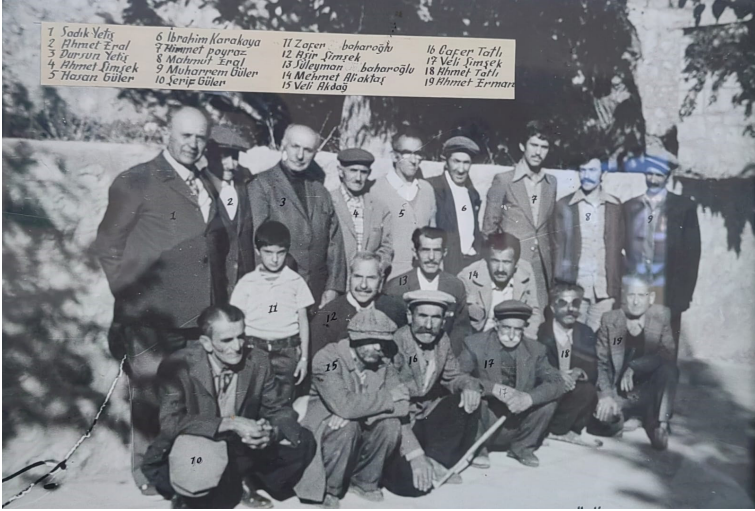
Geçmiş Zaman Olur ki, Ocaklıların Köy Hatırası