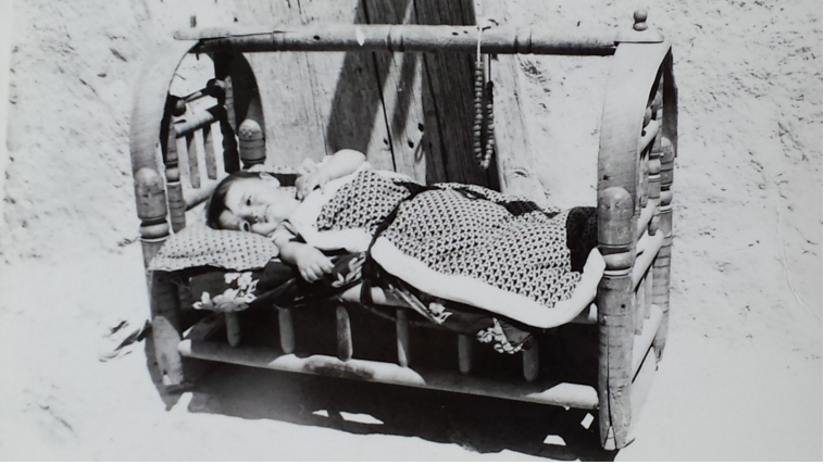
Ocak K y 'nde eskiden kullanılan beşiklerden birisinde uyanan bir yavrumuz.