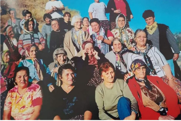
Geçmiş Zaman Olur ki: Ocaklı Hanımların Gezi Hatırası