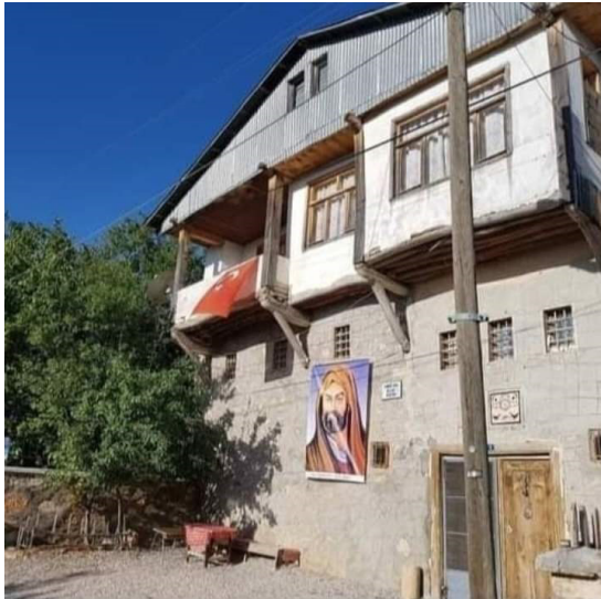
Himmetağaçil'e ait tarihi ev