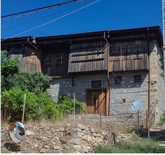
Köyümüzde Tarihi Evlerimizden Musaefendigin Evi