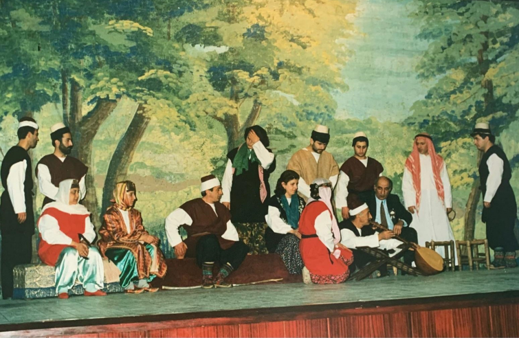
Bütün Oyuncuları Ocaklılardan oluşan ve İstanbul Fatih Reşat Nuri Sahnesi'nde sahnelenen Avni Dilligil'in Dört Kapı Kırk Makam Tiyatro Oyunu