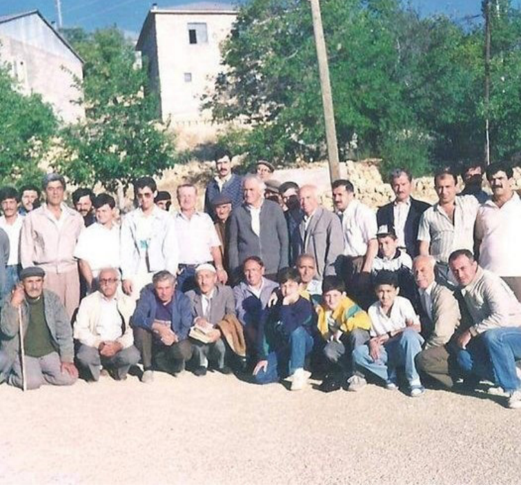
Geçmiş Zaman Olur ki, Ocaklıların Köy Hatırası