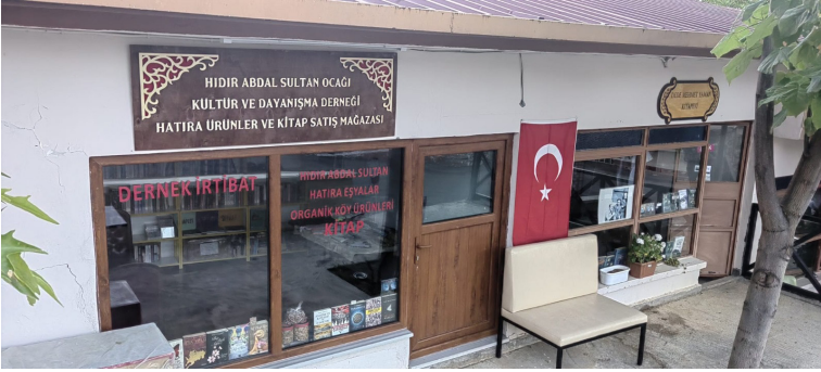
Hıdır Abdal Sultan Ocağı Derneği İrtibat Bürosu ve Dede Mehmet Yaman Kitabevi'nden bir görünüm